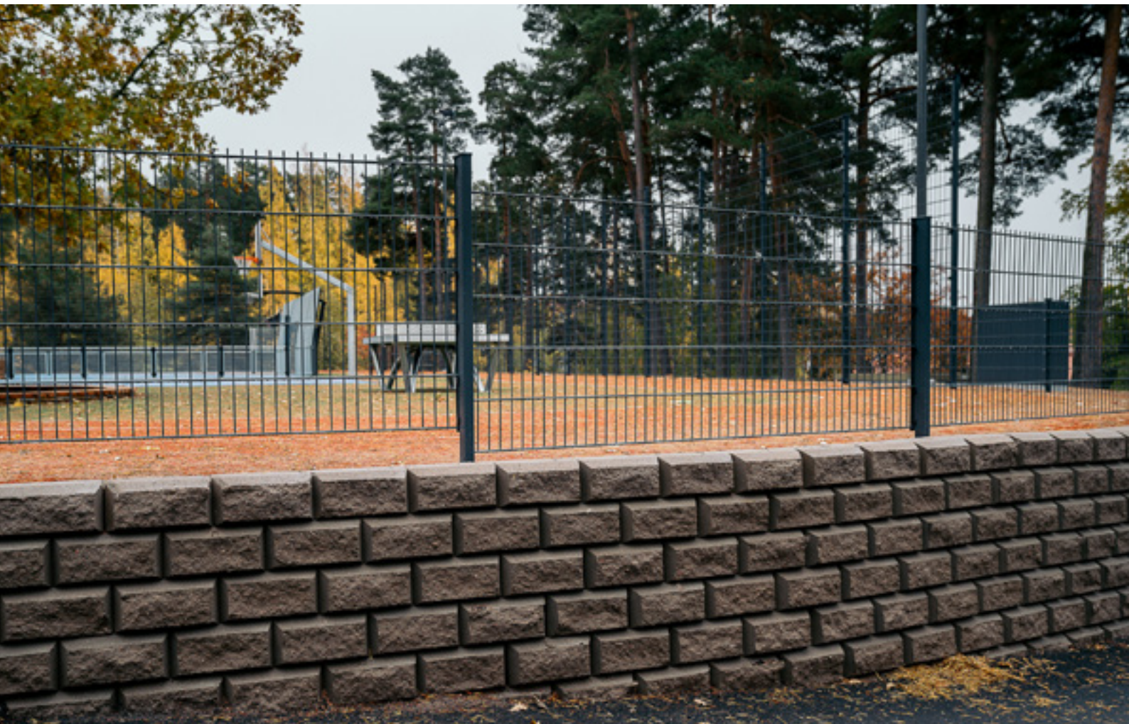
ESKOO-MUURIKIVI, harmaa, lohkopinta