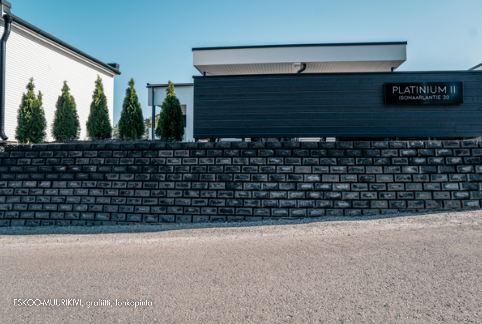
ESKOO-MUURIKIVI, grafiitti, lohkopinta