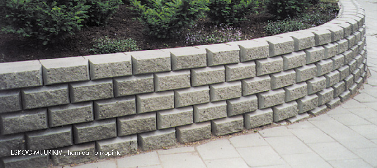
ESKOO-MUURIKIVI, harmaa, lohkopinta

Koot ilmaistu pituus (p) x syvyys (s) x korkeus (k)