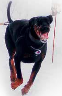
Kickspark MAX Hankijalaksin, Koiravetoadapterilla ja Tuplajarrulla