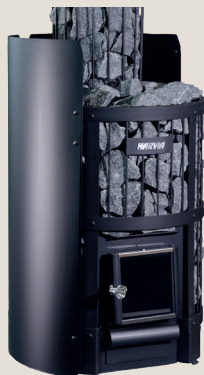
Kiukaan suojaseinä WL200