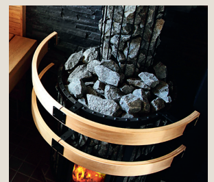
Legend suojakaide SASP0240