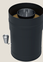
Teräspiipun savupelti WHP270SPM