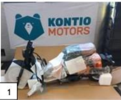
1 Kruiser Elektra runko osittain kasattuna. (kuva 1) Tarkista tehdas kiinnitteisten osien kiinnitykset.

Irto-osissa voi olla poikkeavaisuuksia riippuen valmistuserästä. Kontio Kruiserin Elektran suojaamiseksi kuljetuksen aikana laite toimitetaan osittain kasattuna. Asenna Kruiser käyttövalmiiksi seuraavien ohjeiden mukaisesti. Avatessasi pakkausta varo, että pakkaus ei puhkea, jottei sisältö vaurioitu. Kun olet avannut paketin, tarkista, että seuraavat osat ovat mukana: