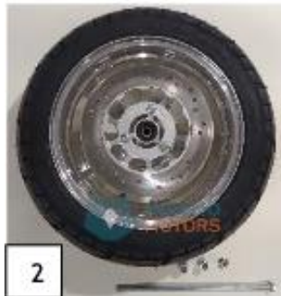
2 Eturengas ja etuakseli. (kuva 2).