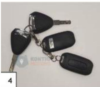
4 Avaimet. (kuva 4).