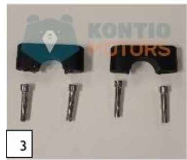
3 Tangon kiinnikkeet ja kiinnikeruuvit. (kuva 3).