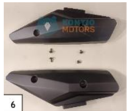
6 Kylkipaneeli. (kuva 6).