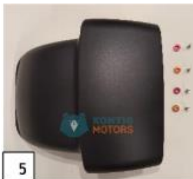
5 Etulokasuoja. (kuva 5).